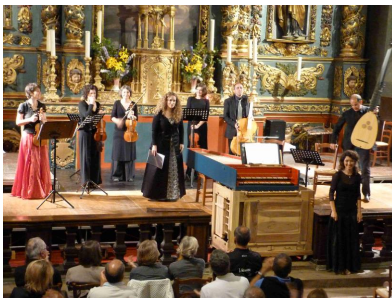
Ensemble Gli incogniti Festival