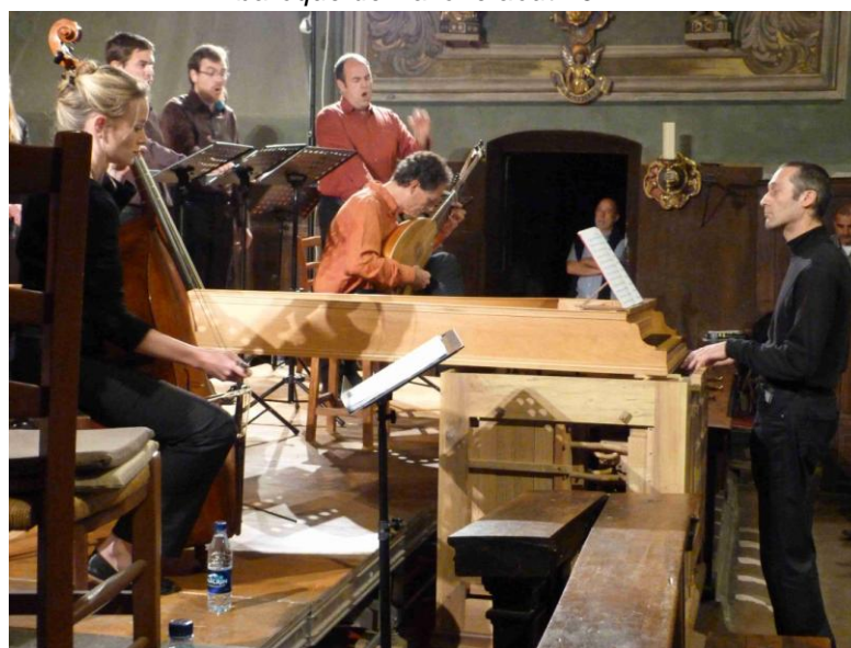
Ensemble La Chapelle Rhénane